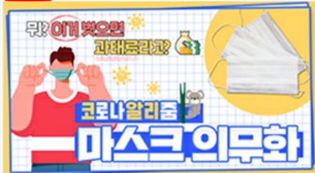
[코로나 뭐든 알리줌 3편] 뭐? 이거 벗으면 과태료 부과?! 마스크 의무화의 모든 것